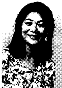
主角演员·沟口贵子

1926~1988年。生于九州熊本县天草。自12岁至日本战败前一年七年间，在北京的日本中学念书。1950年九州大学经济学部毕业，经过任职高中教师后，自52年，边在法务省保护局工作，边组织了地区的话剧小组“麦之会”。1962年，他的剧本《机制作战》获得了岸田剧本奖，自此独立为剧作家。他与现实主义作品得心应手，主题明确结构显明。他深受鲁迅批判本国盲目照搬西方表面文明风潮的影响。1981年，他特意访华，参加了鲁迅诞生一百周年纪念大会，对中国感受颇深。他的代表作有《明治之棺》描写一位民权运动家在1900年前后站在农民运动一边为反对铜矿的毒污染而斗争的故事。还有描写1900年初的日本社会主义者、工会运动者的群像——《美好的人们的传说》，除此之外留下了无数的剧本、电视剧等。